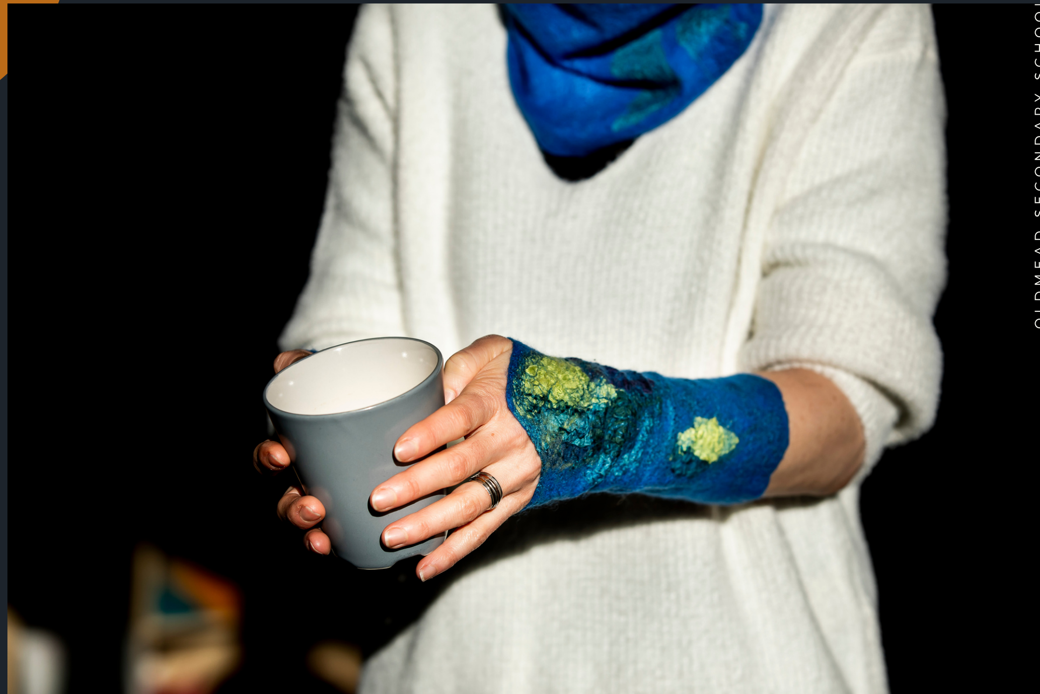
mitenki i komin wykonane z wełny merynosów z jedwabną dekoracją