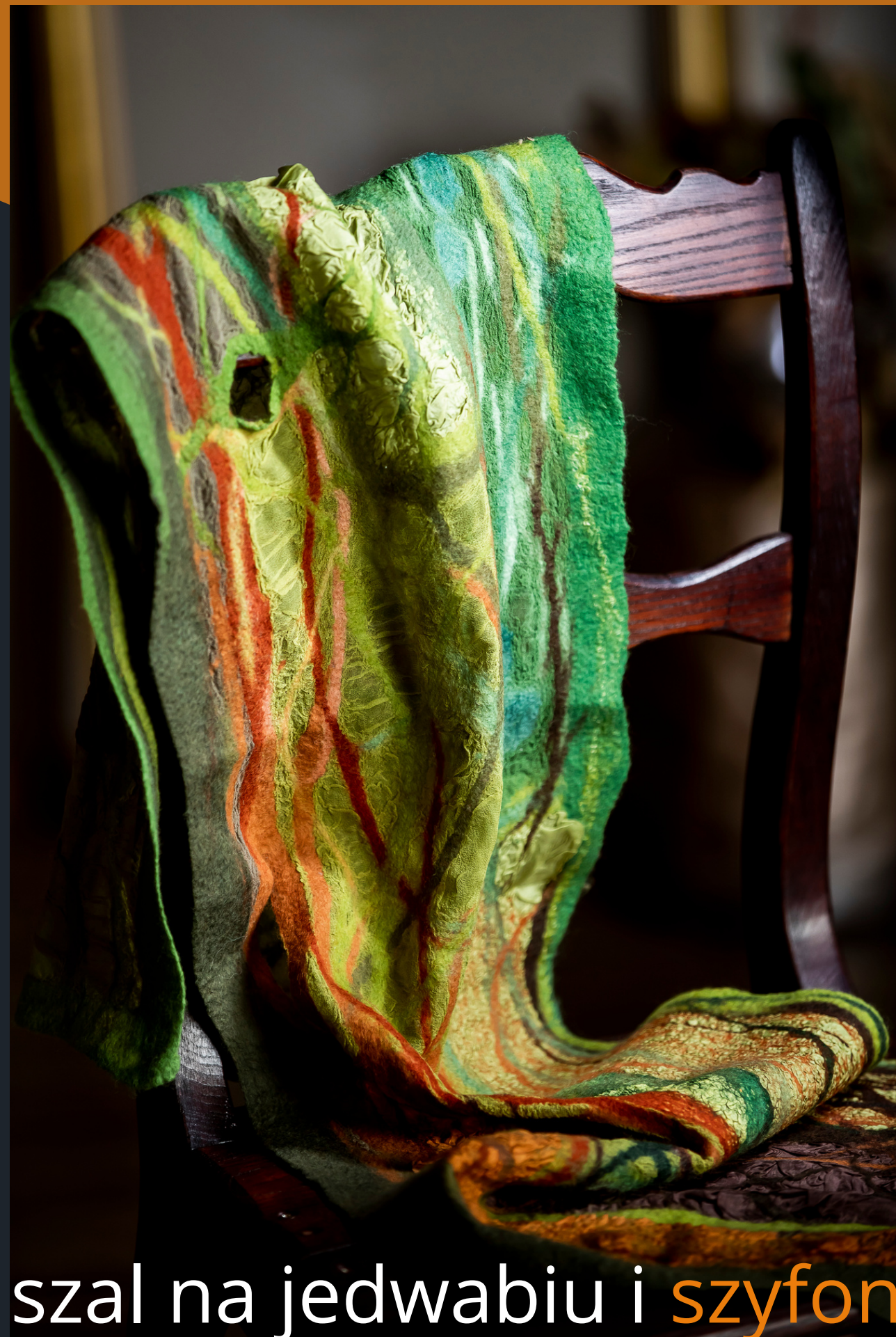
szal na jedwabiu i szyfonie