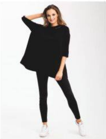
Kamela Look 32