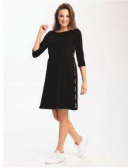
Palermo Look 405