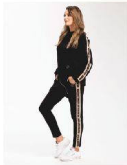
Marsala Look 810