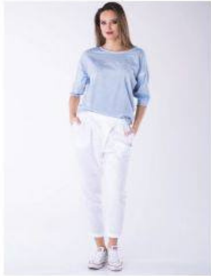
Fine Look 602F