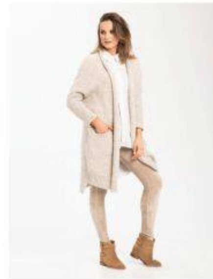
Anuschka Look 125