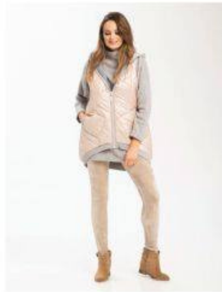
Marilleva Look 813