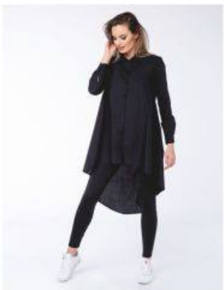
Kendy Look 504