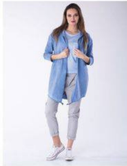
Nicea Look 600F