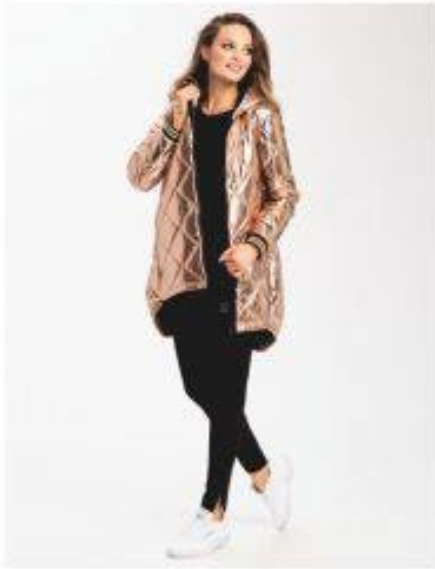
Umbrella Look 302