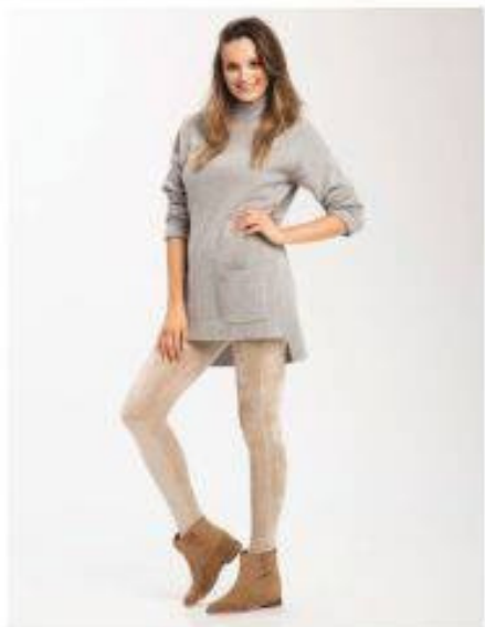
Ambrossy Look 213