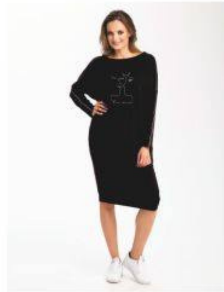
Kiss Look 820