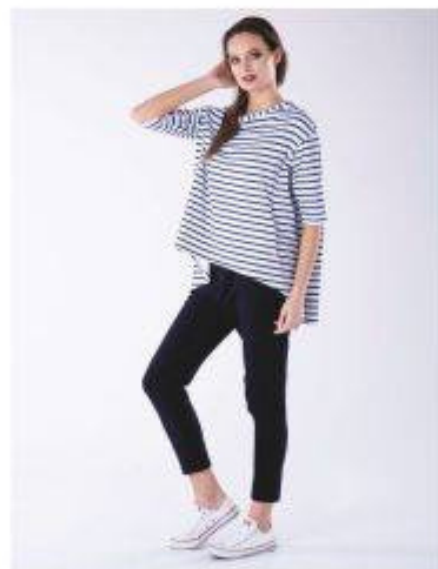
Portofino Look 32P