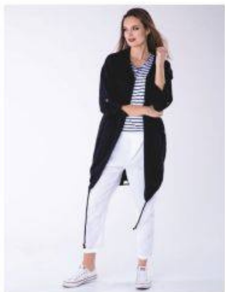
Magnolia Look 600