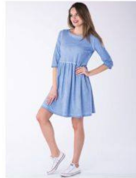
Fiesta Look 405F