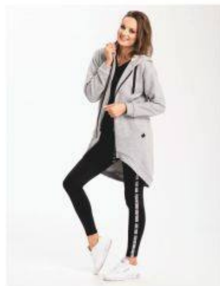
Amadeo Look 815