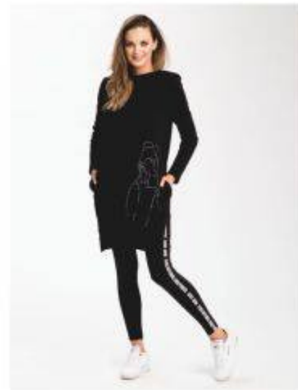
Modigliani Look 19